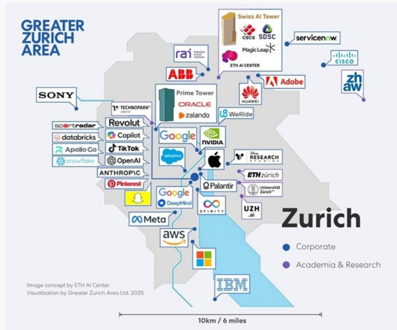
Abbildung 1: Clustering der globalen AI-Leaders in Zürich (Wissenschaft und Unternehmen)